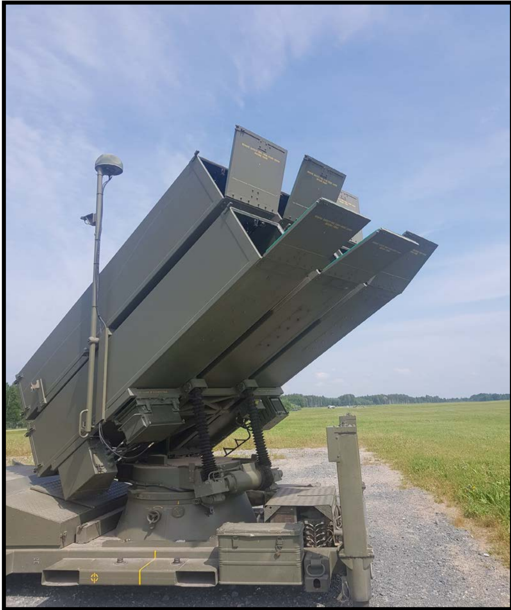
Misiles NASAMS españoles (RAAA 73 de Cartagena) en Letonia